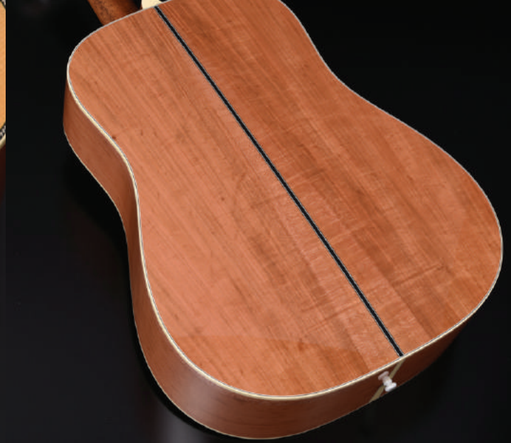
ボディのサイド・バックには桜の木を使用。一音一音粒のそろった音を生み出します。