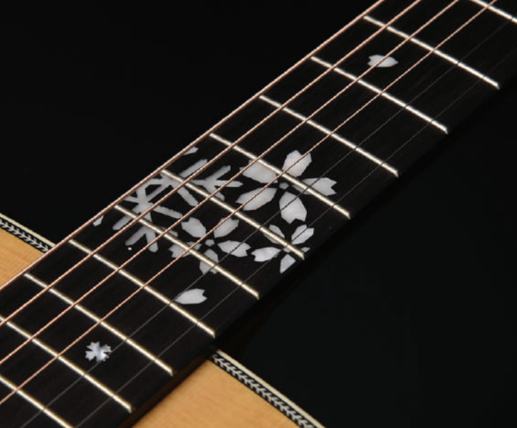
12フレットと5フレット付近に雪と桜をモチーフとしたインレイを大きく配置しました。