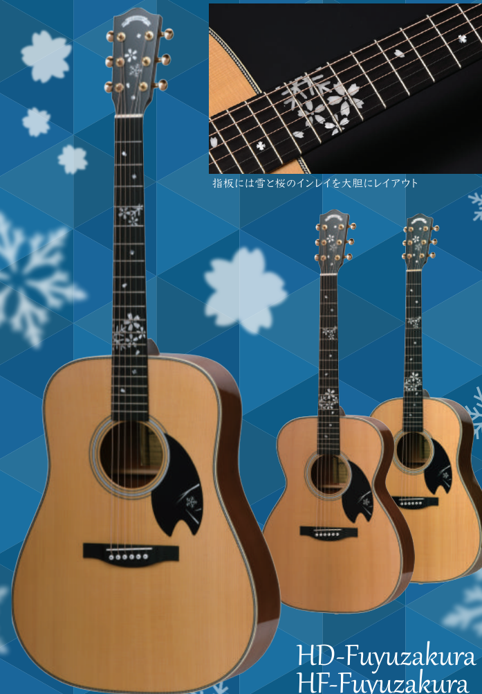
指板には雪と桜のインレイを大胆にレイアウト

HD-Fuyuzakura HF-Fuyuzakura HJ-Fuyuzakura