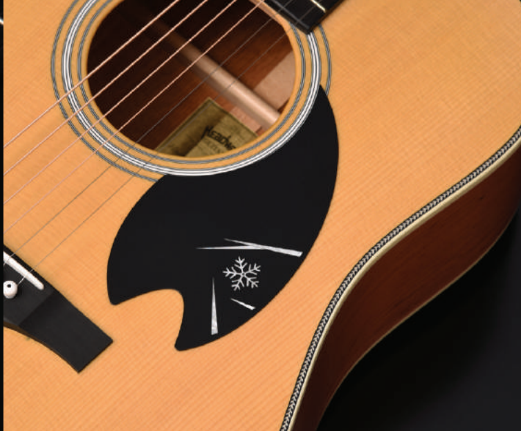
ピックガードには雪の結晶を。