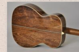
▲板目で木取ることで一際迫力ある外観に。