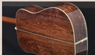
▲ニューハカランダとも呼ばれる「ホンジュラスローズウッド」