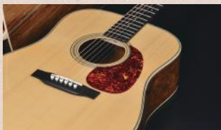
▲希少性が極めて高い北米産アディロンダックスプルース

さらにヘッドウェイの豊富な木材ストックの中でも特に希少なアディロンダックスプルースをボディトップだけでなくブレイシングにまで使用し、加えてボディのサイド・バックにはホンジュラスローズウッドを使用しました。ローズウッドの中でも低音域、高音域ともに豊かに響くホンジュラスローズと、アディロンダックスプルースの組み合わせにより、倍音成分がしっかりと出るリッチで豪華なサウンドが実現しました。