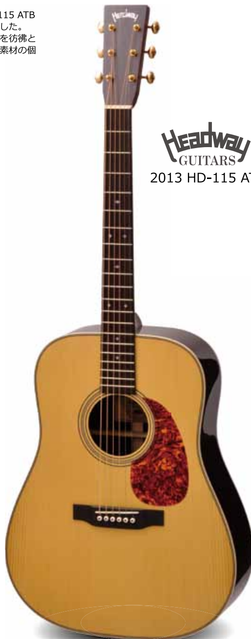
Headway GUITARS 2013 HD-115 ATB